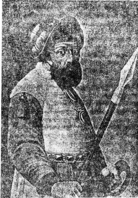
Атаманъ Ермакъ Тимофеевичъ.

среда, строго соблюдавшая церковный византійскій уставъ и преклонявшаяся предъ его требованіями, даже и въ походной жизни.